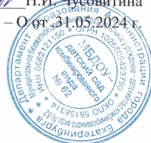
График занятий по ПДД на учебно-тренировочном перекрёстке МБДОУ – детский сад комбинированного вида №62 на 2024-2025 учебный год